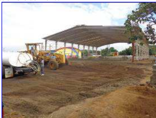
Panorámica costado Oeste del Gimnasio de Baloncesto en el Polideportivo España, a la izquierda apreciar el Gimnasio situación sin proyecto. En la fotografía de la derecha apreciar situación actual del proyecto.