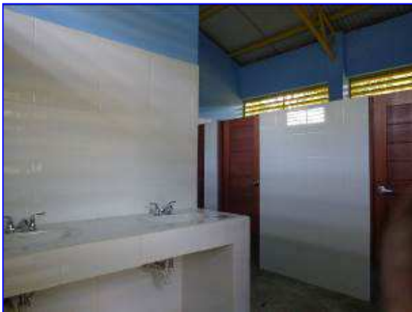
Vista interna de la batería sanitaria de mujeres, con proyecto.

El 07 de septiembre se realizó la recepción final de las obras a entera satisfacción del IND.