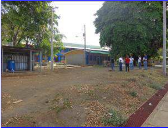
Vista panorámica del sitio donde se construyó el edificio de vestidores de Volibol de Playa. Situación sin proyecto.