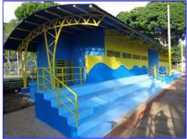
Fachada principal del edificio de vestidores de Volibol de Playa, donde se observa la gradería para público.

El proyecto consistió en dotar de vestidores adecuados para los deportistas del Volibol de Playa; así como servicios sanitarios y gradería techada para el público en general, ampliándose la capacidad de gradería existentes de 422 personas a 580 espectadores.